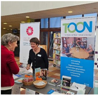
Elisabeth TweeSteden ziekenhuis

In het kader van Wereldkankerdag op 4 februari, werden er verschillende activiteiten in de regio georganiseerd. Zo was TOON aanwezig in het Elisabeth TweeSteden ziekenhuis, Instituut Verbeeten en organiseerden we zelf op zaterdag 3 februari de open dag bij TOON. We hebben vele patiënten, naasten en professionals gesproken op deze mooie dagen.